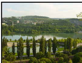
Vue du belvédère du Lac