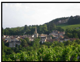
Vue sur Pernand-Vergelesses

« Après l'effort, le réconfort », dit le dicton, alors n'hésitez à terminer votre marche par une dégustation chez l'un des nombreux producteurs de vin du secteur.