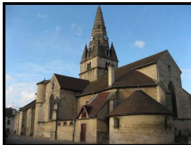
L'église de Savigny-lès-Beaune