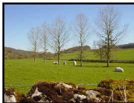
Vallon de Champagny